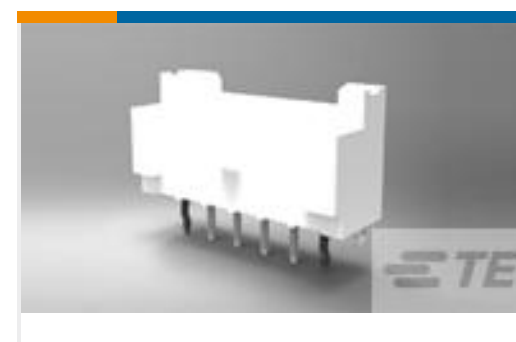
TE 产品编号1-2132415-3 EP2.5 Shrouded HDR ASSY 13P VERT w/oboss