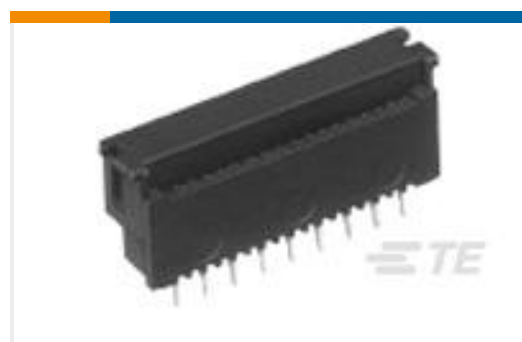
TE 产品编号1-487576-2 20 ZIFLINE 50 ASSY