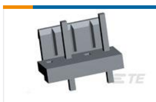
TE 产品编号2-1473057-2 EP CONN. HDR ASSY 2/4P NATURAL (NO.1,3 P)