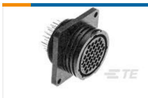
TE 产品编号1-213928-1 CPC PSTD RCPT ASSY SZ 20-14 LF