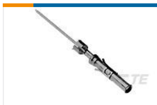
TE 产品编号1-66473-7 SKT,.062 DIA,.045 SQ POST,LP