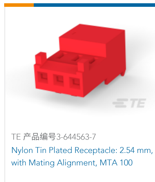
TE 产品编号3-644563-7 Nylon Tin Plated Receptacle: 2.54 mm, with Mating Alignment, MTA 100