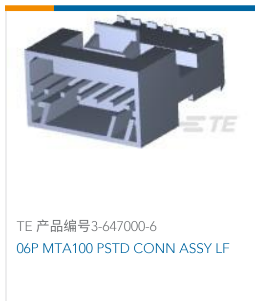
TE 产品编号3-647000-6 06P MTA100 PSTD CONN ASSY LF