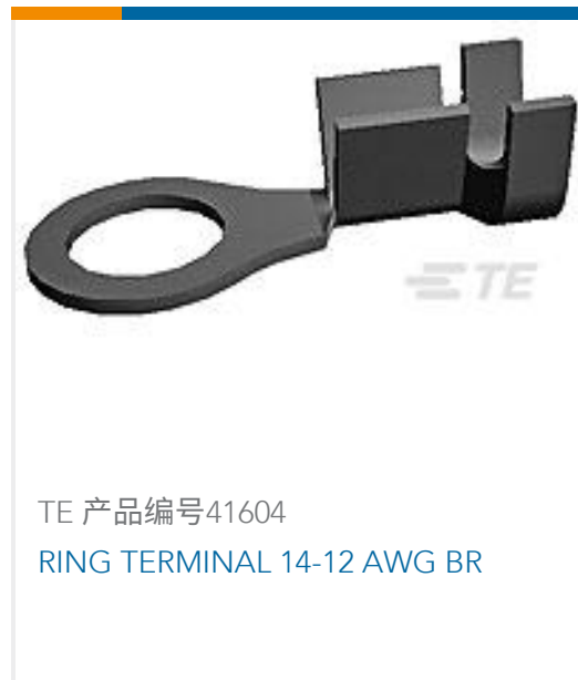
TE 产品编号41604 RING TERMINAL 14-12 AWG BR