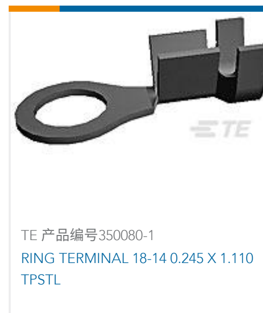
TE 产品编号350080-1 RING TERMINAL 18-14 0.245 X 1.110 TPSTL