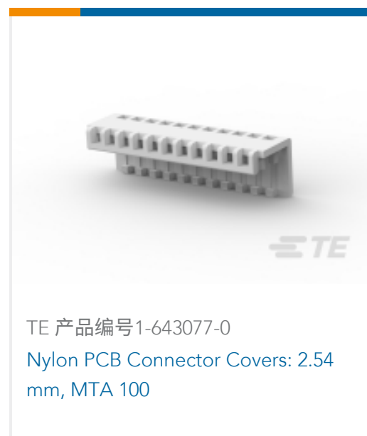
TE 产品编号1-643077-0 Nylon PCB Connector Covers: 2.54 mm, MTA 100