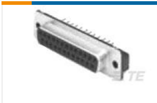
TE 产品编号1-5747150-4 09 RCPT SP/FMS SCRLK