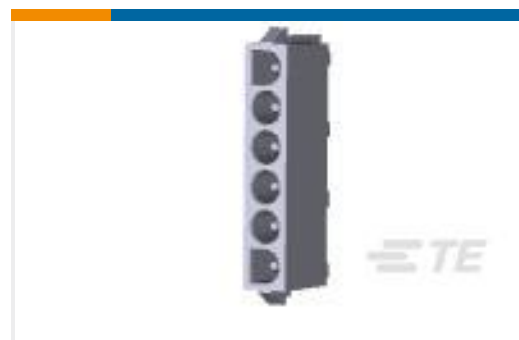
TE 产品编号643407-1 06P UMNL PIN HDR ASSY POL NATL