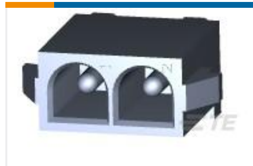
TE 产品编号194009-1 PIN ASSY..070