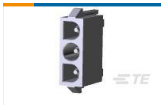
TE 产品编号641965-1 03P UMNL PIN HDR ASSY V2 NATL