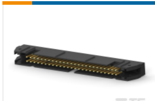
TE 产品编号5499206-8 AMP 锁门通用插头