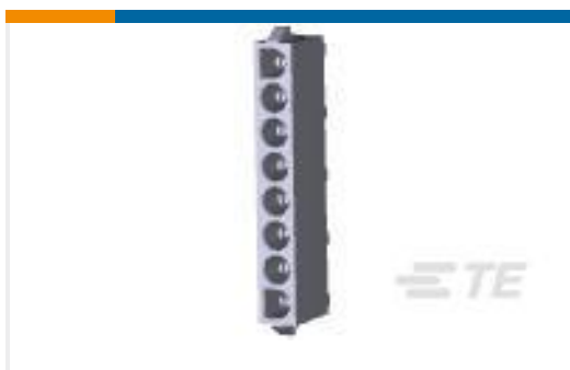
TE 产品编号643410-1 08P UMNL PIN HDR ASSY POL 94VO