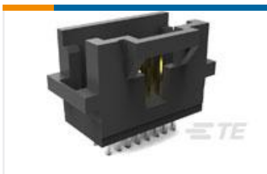
TE 产品编号6-104068-6 80 SYSTEM 50 HDR DRST SHRD