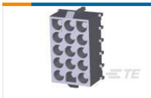
TE 产品编号643430-1 15P UMNL HDR ASSY POL 94VO