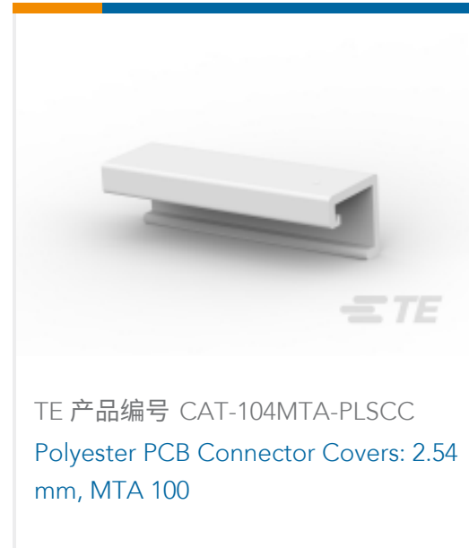
TE 产品编号 CAT-104MTA-PLSCC Polyester PCB Connector Covers: 2.54 mm, MTA 100