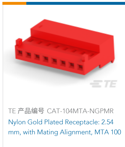
TE 产品编号 CAT-104MTA-NGPMR Nylon Gold Plated Receptacle: 2.54 mm, with Mating Alignment, MTA 100