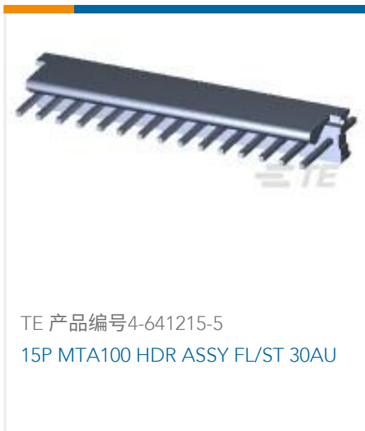
TE 产品编号4-641215-5 15P MTA100 HDR ASSY FL/ST 30AU