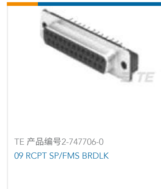
TE 产品编号2-747706-0 09 RCPT SP/FMS BRDLK