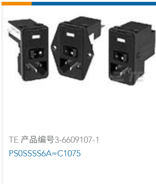
TE 产品编号3-6609107-1 PS0SSS6A=C1075