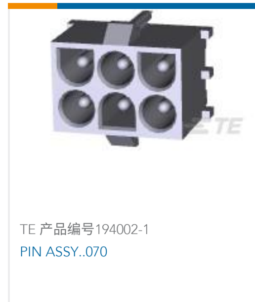
TE 产品编号194002-1 PIN ASSY..070