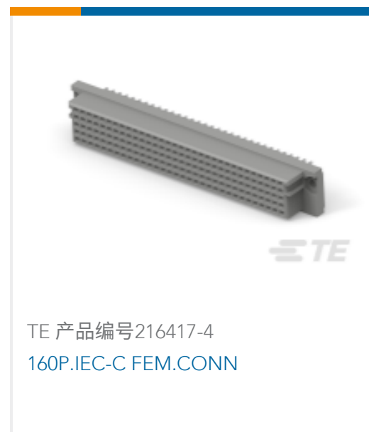
TE 产品编号216417-4 160P.IEC-C FEM.CONN