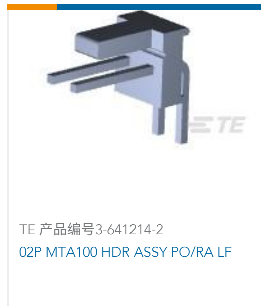
TE 产品编号3-641214-2 02P MTA100 HDR ASSY PO/RA LF