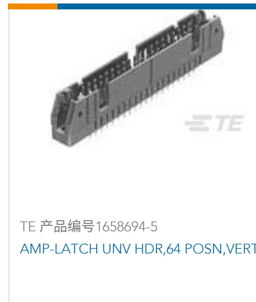
TE 产品编号1658694-5 AMP-LATCH UNV HDR,64 POSN,VERT