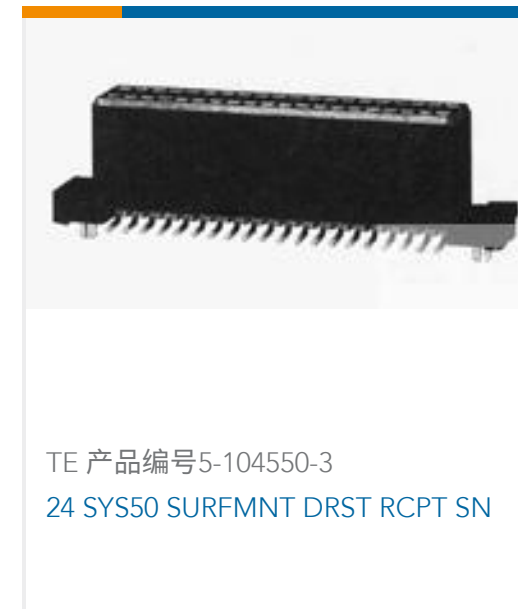
TE 产品编号5-104550-3 24 SYS50 SURFMNT DRST RCPT SN