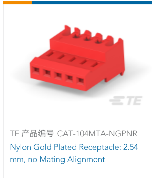
TE 产品编号 CAT-104MTA-NGPNR Nylon Gold Plated Receptacle: 2.54 mm, no Mating Alignment