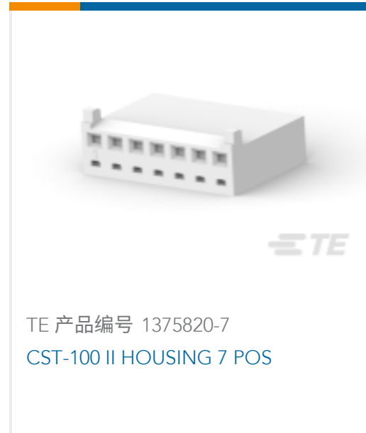
TE 产品编号 1375820-7 CST-100 II HOUSING 7 POS