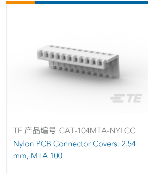
TE 产品编号 CAT-104MTA-NYLCC Nylon PCB Connector Covers: 2.54 mm, MTA 100