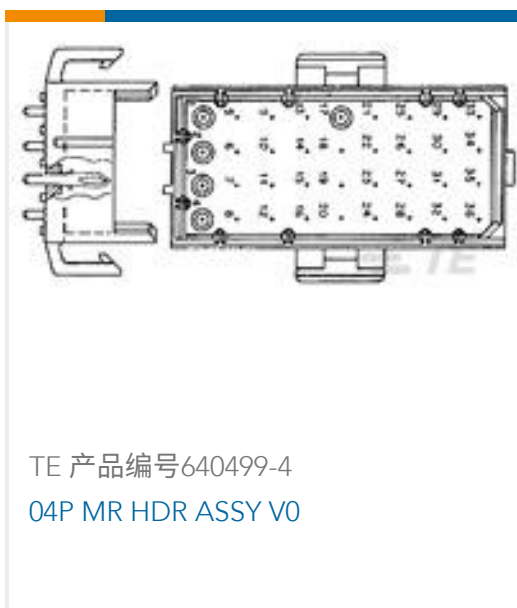
TE 产品编号640499-4 04P MR HDR ASSY V0