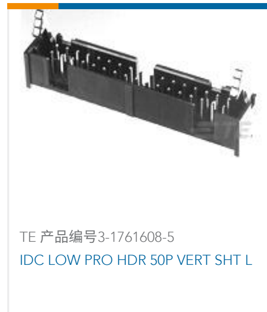
TE 产品编号3-1761608-5 IDC LOW PRO HDR 50P VERT SHT L