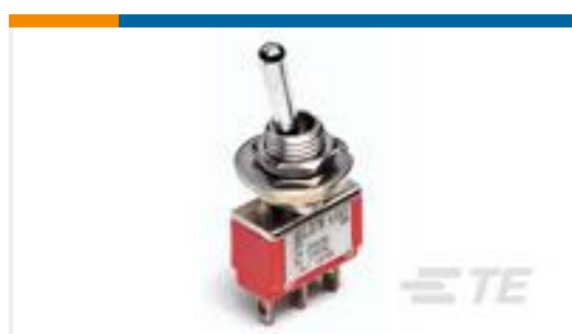
TE 产品编号1825139-2 A203MD9AB04