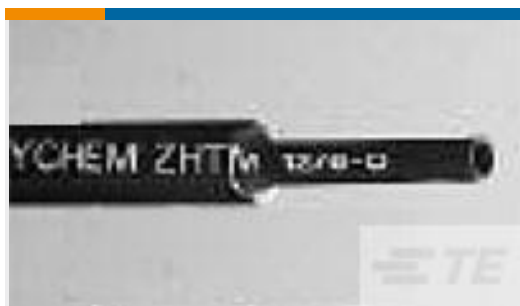
TE 产品编号2450984003 ZHTM-40/20-0-SP