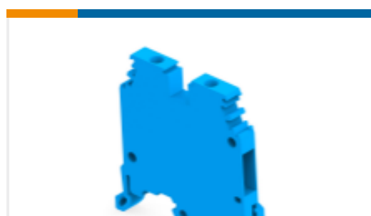
TE 产品编号1SNA125486R0500 MA2.5/5.N