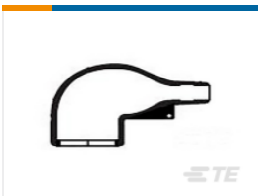
TE 产品编号EF9981-000 222K121-25L/225-0