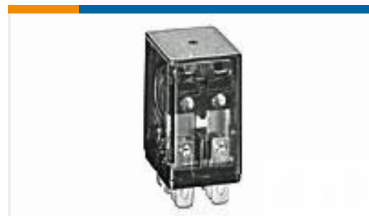
TE 产品编号5-1393144-1 K10P-11DT5-24=K10/K20