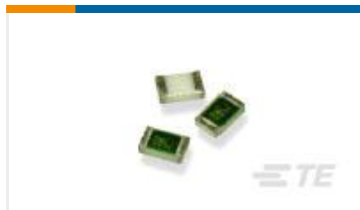
TE 产品编号7-1879214-9 CPF 0402 2K43 0.1% 25PPM 1K RL