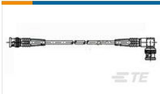
TE 产品编号1337772-2 50/OHM COAX BNC STR PLUG ELB P