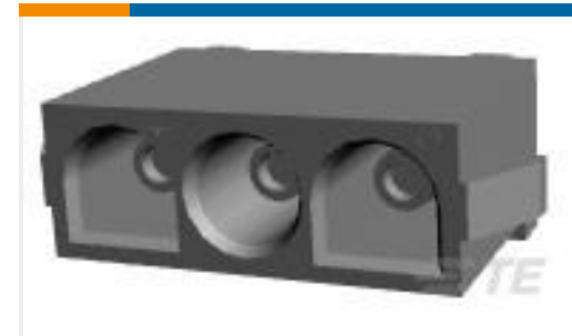
TE 产品编号350760-4 03P UMNL HDR ASSY PC