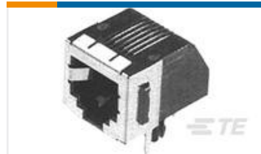
TE 产品编号5555154-1 MJ,R/A,LPF,6P/6C,SHLD,PNL,TRAY