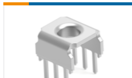
TE 产品编号214801-E EPSVA KS GDM3 TL 6 3,8 SN * STROMVERSORG