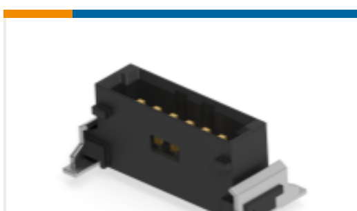
TE 产品编号284698-E SRCP 1,27 6 M 1 SMD 137 E1 094 * GU- H *