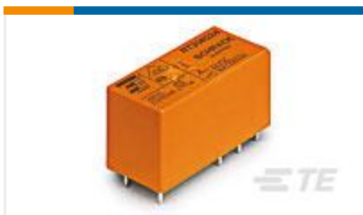
TE 产品编号9-1393243-9 RT444024