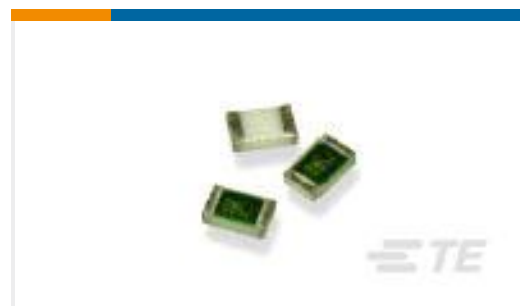
TE 产品编号6-1676481-1 CPF 0603 2K0 0.1% 25PPM 1K RL