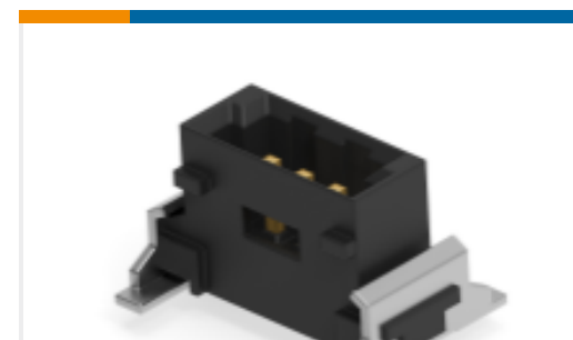
TE 产品编号284696-E SRCP 1,27 3 M 1 SMD 137 E1 094 * GU- H *