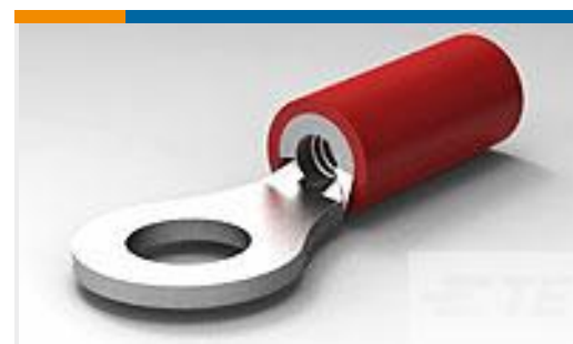
TE 产品编号32951 PG R 22-16 COMM 22-18 MIL 8