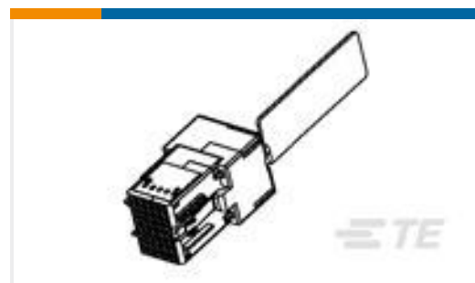
TE 产品编号1376245-1 AMP-MCC CONN 40P KIT