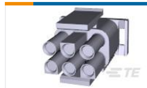
TE 产品编号350715-1 06P UMNL PLUG HSG