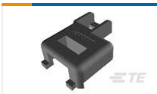
TE 产品编号643182-1 UMNL STR/REL ADAPTER CAP NATL