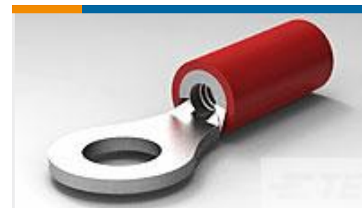
TE 产品编号32951 PG R 22-16 COMM 22-18 MIL 8