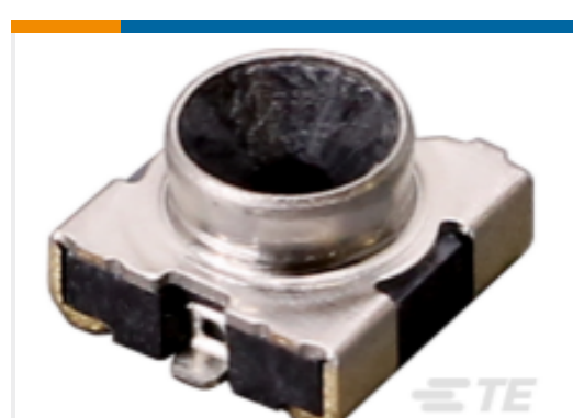
TE 产品编号CONSWD001-SMD SWD Jack 50 Ohm PCB Surface Mount