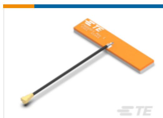
TE 产品编号1-2118909-1 PCB Ant, MHF, 50mm, Wi-Fi 6E Triple