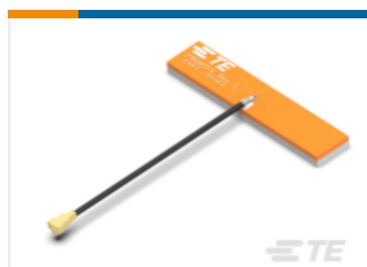
TE 产品编号1-2118909-2 PCB Ant, MHF, 100mm, Wi-Fi 6E Triple