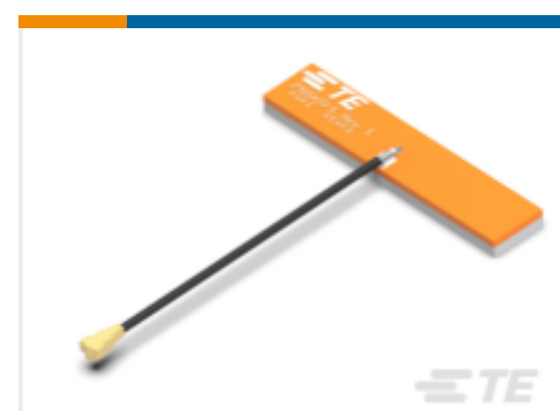
TE 产品编号1-2118909-4 PCB Ant, MHF, 200mm, Wi-Fi 6E Triple