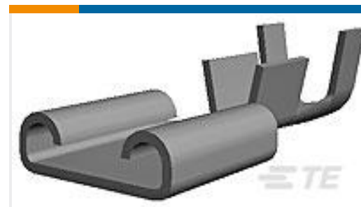
TE 产品编号160389-3 250 FASTON, REC., 24-17 AWG, PNST