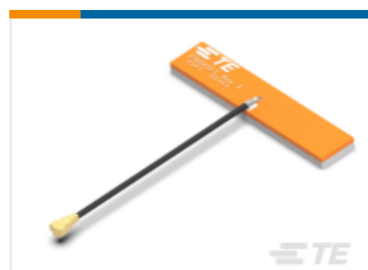
TE 产品编号1-2118909-3 PCB Ant, MHF, 150mm, Wi-Fi 6E Triple