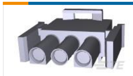
TE 产品编号350766-1 03P UMNL PLUG HSG