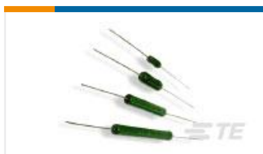
TE 产品编号1-1623773-1 C10 1K0 5% (LOOSE)