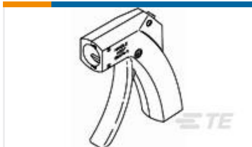
TE 产品编号58074-1 MTA 50/100/156 MANUAL TOOL FRAME