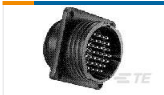
TE 产品编号213862-1 17-16 RCPT HSG,STD SEX,CPC