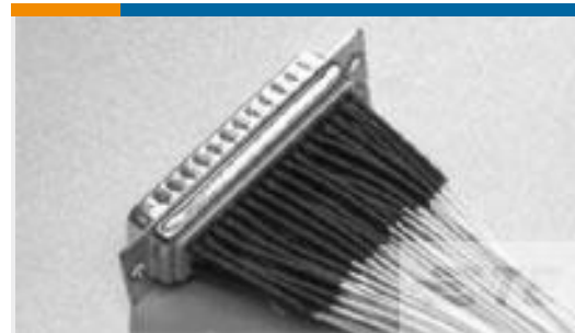
TE 产品编号042787J001 V4-1.5-0-SP-SM