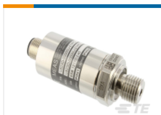
TE 产品编号U5244-000005-030PA PRESS XDCR U5244-000005-030PA