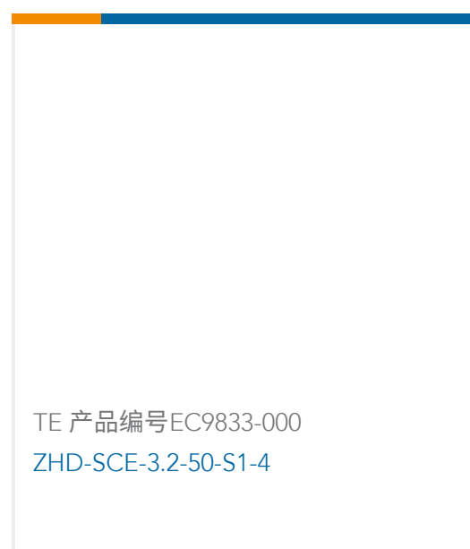
TE 产品编号EC9833-000 ZHD-SCE-3.2-50-S1-4