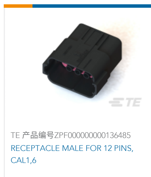
TE 产品编号ZPF000000000136485 RECEPTACLE MALE FOR 12 PINS, CAL1,6