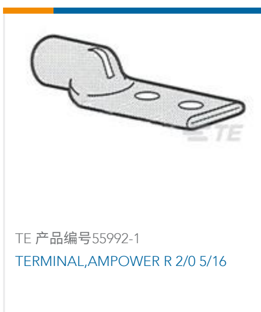
TE 产品编号55992-1 TERMINAL,AMPOWER R 2/0 5/16