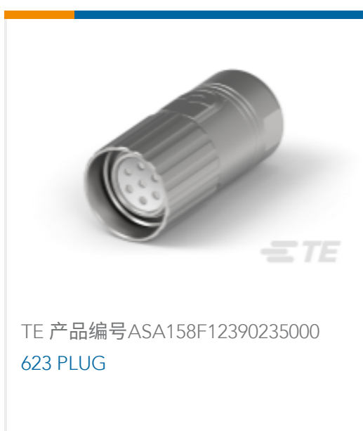
TE 产品编号ASA158F12390235000 623 PLUG