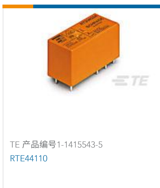
TE 产品编号1-1415543-5 RTE44110