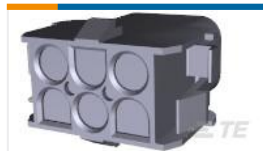
TE 产品编号1-480705-0 06P UMNL CAP HSG NATL