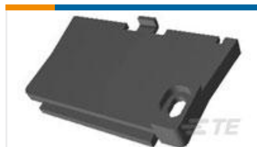
TE 产品编号643314-1 08P UMNL STR/REL