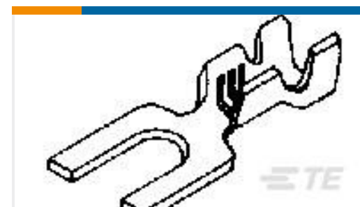
TE 产品编号60389-1 SPADE CRIMP 20-16 AWG BR