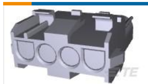
TE 产品编号926305-6 UNML4WAY CAP