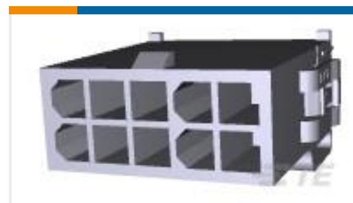
TE 产品编号794197-1 10P MINI UMNL2 CAP HSG UL94V0