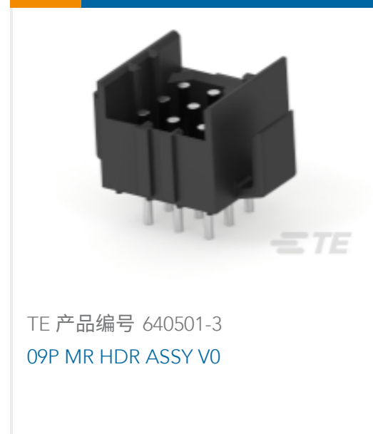
TE 产品编号 640501-3 09P MR HDR ASSY V0