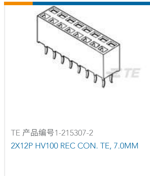
TE 产品编号1-215307-2 2X12P HV100 REC CON. TE, 7.0MM