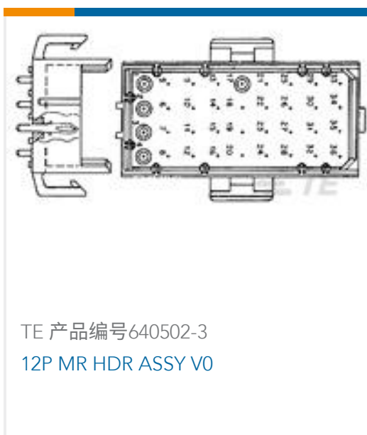
TE 产品编号640502-3 12P MR HDR ASSY V0