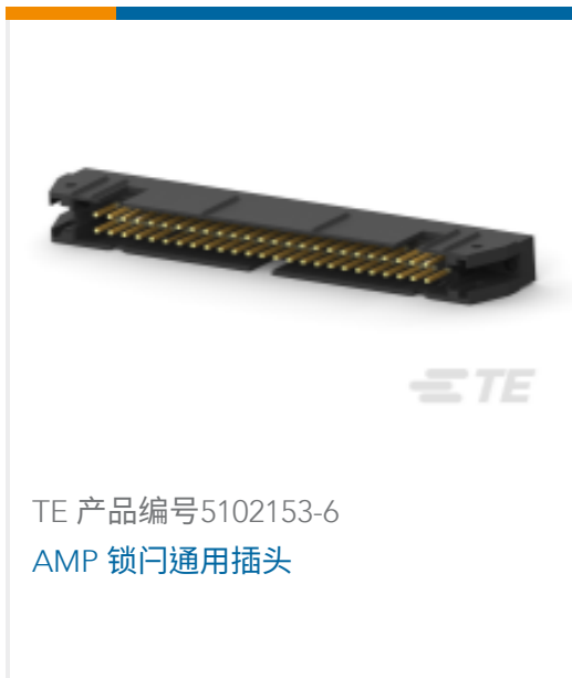
TE 产品编号5102153-6 AMP 锁门通用插头