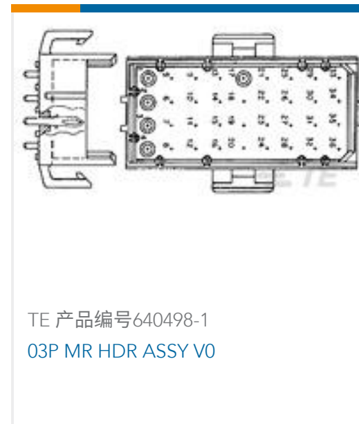
TE 产品编号640498-1 03P MR HDR ASSY V0