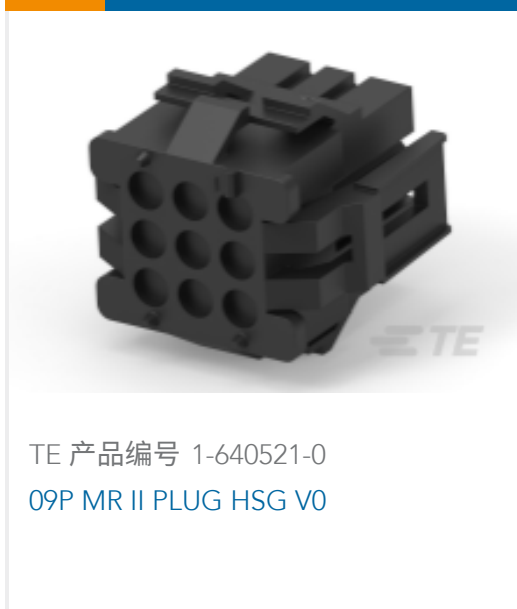
TE 产品编号 1-640521-0 09P MR II PLUG HSG V0