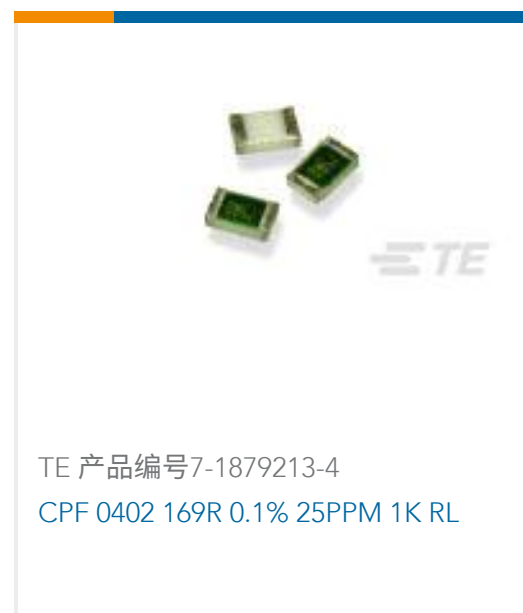
TE 产品编号7-1879213-4 CPF 0402 169R 0.1% 25PPM 1K RL