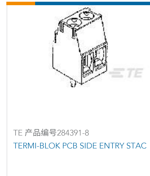
TE 产品编号284391-8 TERMI-BLOK PCB SIDE ENTRY STAC