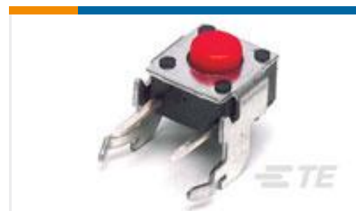
TE 产品编号1571610-1 Sealed R/A Tact switch, Sealed