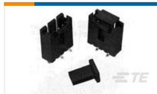
TE 产品编号5-1375582-4 05 MTE VERTICAL SMT HDR 15 AU