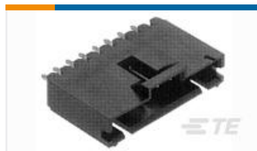
TE 产品编号103670-6 07 MTE HDR SRST LATCH W/HLDWN