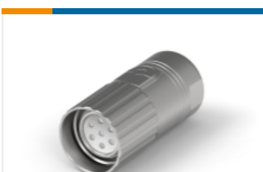
TE 产品编号ASA158F12390235000 623 PLUG