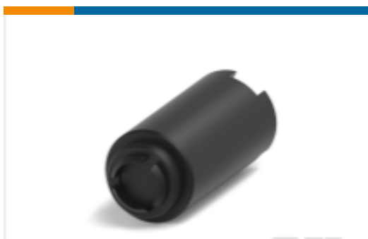
TE 产品编号YZ-KC-212751A-PY00 TOOL DISMOUNTING - FXP2