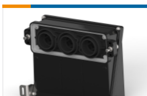
TE 产品编号ZPF000000000205373 PLUG MALE ANG.90 CAL.20 - FXP