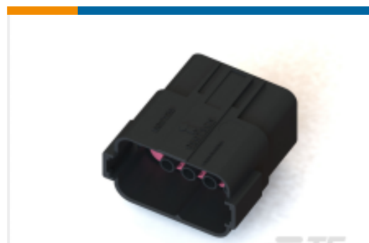
TE 产品编号ZPF000000000136485 RECEPTACLE MALE FOR 12 PINS, CAL1,6