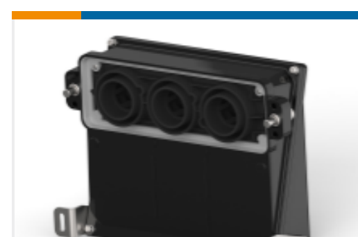
TE 产品编号ZPF000000000205373 PLUG MALE ANG.90 CAL.20 - FXP