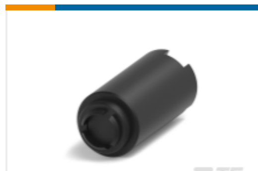
TE 产品编号YZ-KC-212751A-PY00 TOOL DISMOUNTING - FXP2