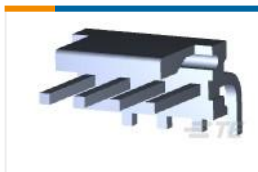
TE 产品编号640389-4 04P MTA156 HDR ASSY SQ R/A F/L