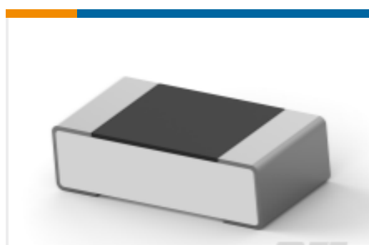
TE 产品编号3-2176372-3 RQ 0603 107K 0.1% 10PPM 5K RL