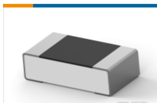
TE 产品编号3-2176372-1 RQ 0603 102K 0.1% 10PPM 5K RL