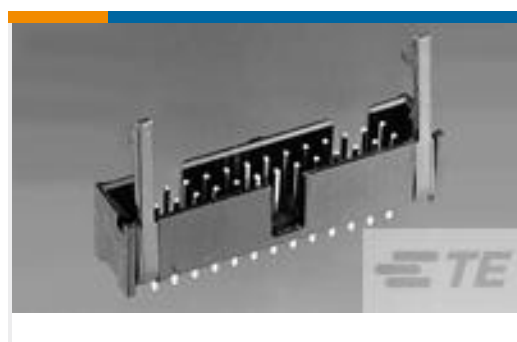
TE 产品编号2-1761609-5 IDC LOW PRO HDR 14P RA SHT LAT BLUE