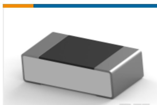
TE 产品编号8-2176370-6 RQ 0603 3K32 0.1% 10PPM 5K RL