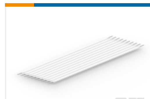
TE 产品编号5-1474644-1 FSN-24A-7