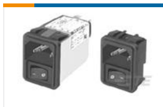
TE 产品编号6609113-9 6CFE1=F7833 S0