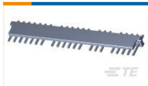
TE 产品编号644713-2 24P MTA156 HDR W/O#6,10,17