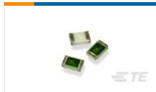
TE 产品编号1879208-5 CPF 0402 15R 0.1% 25PPM 1K RL