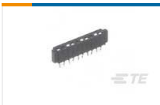
TE 产品编号5-520315-4 TRIOMATE ASSY V 4P L=3.556LDFR