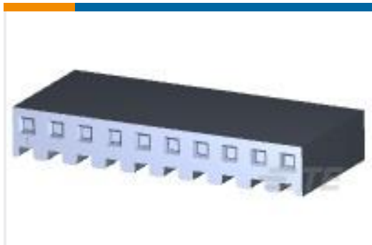
TE 产品编号1-640251-0 10P SL156 HSG W/O LCK RAMP