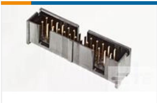
TE 产品编号5103309-7 A/L LOW PRO HDR 34P VERT BLACK