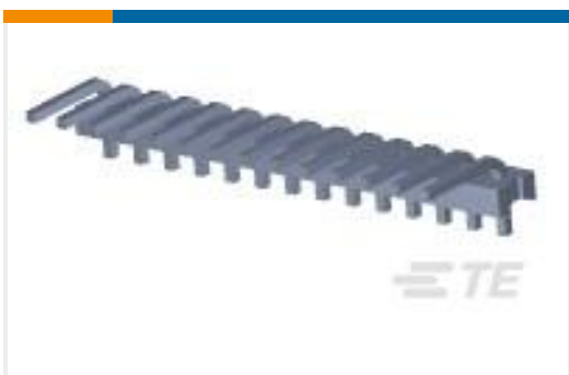
TE 产品编号1-640385-4 14P MTA156 HDR ASSY SQ R/A