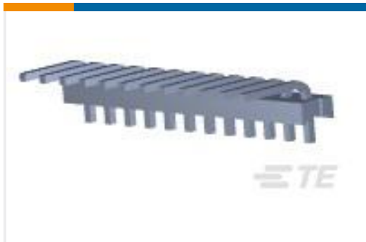
TE 产品编号1-640385-2 12P MTA156 HDR ASSY SQ R/A