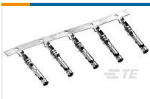
TE 产品编号66100-6 III+ SKT, 18-16, 30AU > 10, STRIP