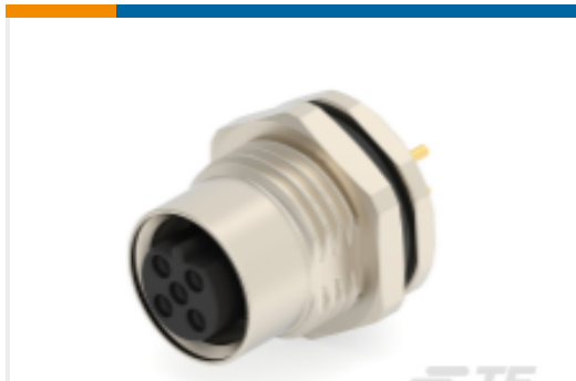
TE 产品编号T4141412051-000 M12,REAR MOUNTING,FEMALE,B CODE,5P