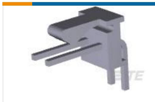
TE 产品编号640457-2 02P MTA100 HDR ASSY SQ R/A F/L