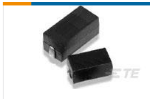
TE 产品编号2-1879022-1 SMF3 2K2 5%