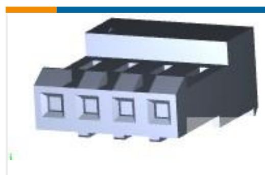
TE 产品编号3-640427-4 04P MTA156 CONN ASSY 20AWG YEL