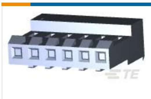
TE 产品编号3-640427-6 06P MTA156 CONN ASSY 20AWG YEL