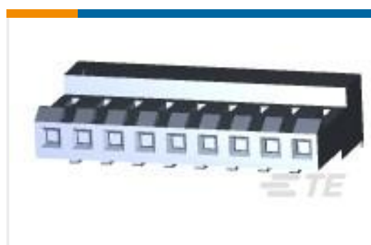
TE 产品编号3-640427-9 09P MTA156 CONN ASSY 20AWG YEL