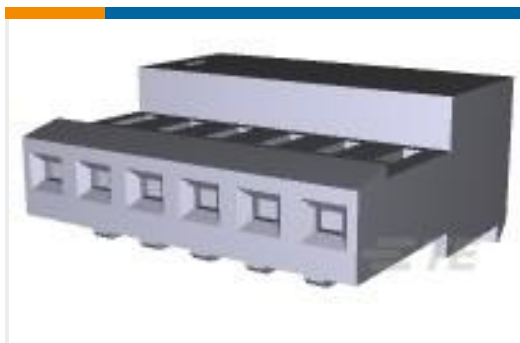
TE 产品编号3-640441-6 06P MTA100 CONN ASSY WHT