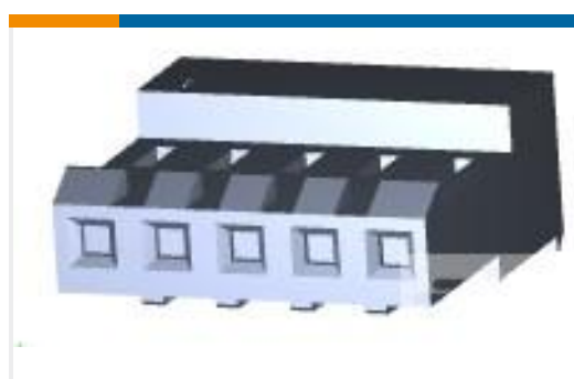
TE 产品编号3-640427-5 05P MTA156 CONN ASSY 20AWG YEL