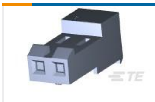
TE 产品编号3-640427-2 02P MTA156 CONN ASSY 20AWG YEL