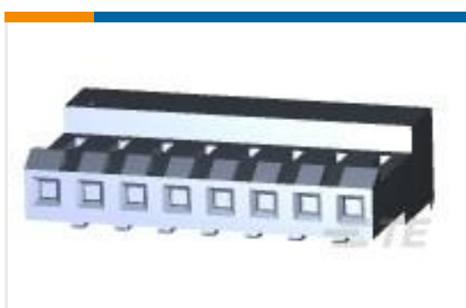
TE 产品编号3-640427-8 08P MTA156 CONN ASSY 20AWG YEL