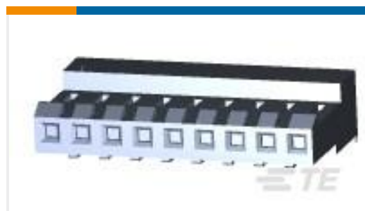
TE 产品编号3-640427-9 09P MTA156 CONN ASSY 20AWG YEL