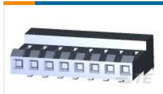
TE 产品编号3-640427-8 08P MTA156 CONN ASSY 20AWG YEL