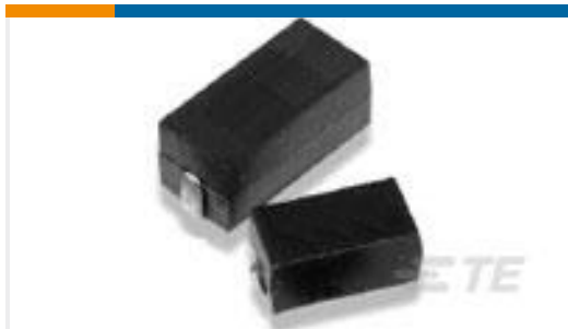
TE 产品编号2-1879022-1 SMF3 2K2 5%