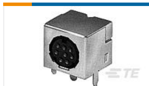
TE 产品编号5749265-1 Mini DIN, 6 pos, R/A, Shield