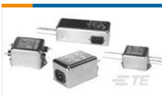
TE 产品编号6609054-1 3EHQ1=F7671 S0