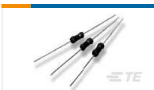
TE 产品编号4-1879352-1 RR02 5% 15R AMMO