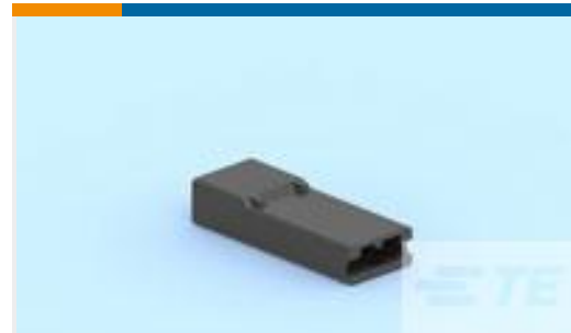
TE 产品编号1-2133346-4 250 FASTON HSG.,REC.,1 POS,BLACK