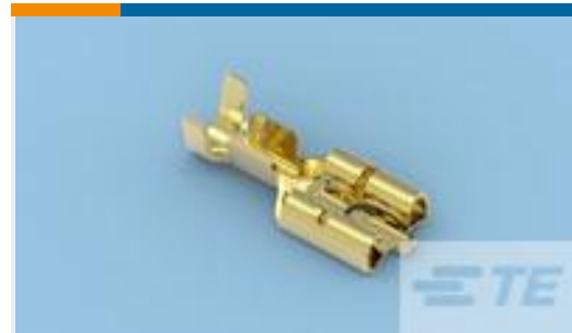
TE 产品编号444335-3 250 FASTON REC 16-14 AWG BR