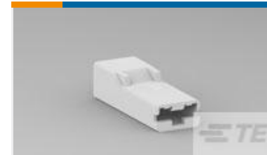
TE 产品编号2-2133394-1 187 FASTON HSG.,REC.,1 POS, NATRUAL