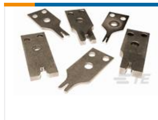
TE 产品编号6-573447-4 INSULATION CRIMPER