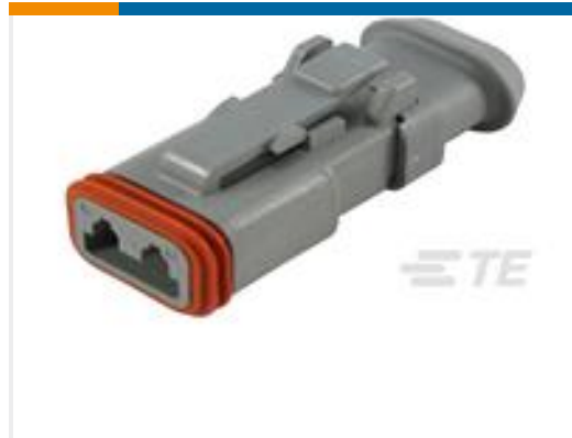
TE 产品编号DT06-2S-E008 PLG, 2P, GRY, N, XCAP