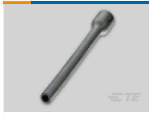
TE 产品编号868601-000 小尺寸热缩护套：吹塑，细线电缆，有嘴，直形