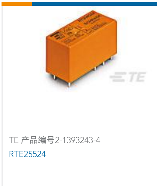
TE 产品编号2-1393243-4 RTE25524