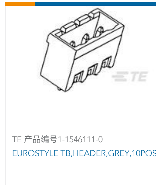
TE 产品编号1-1546111-0 EUROSTYLE TB,HEADER,GREY,10POS