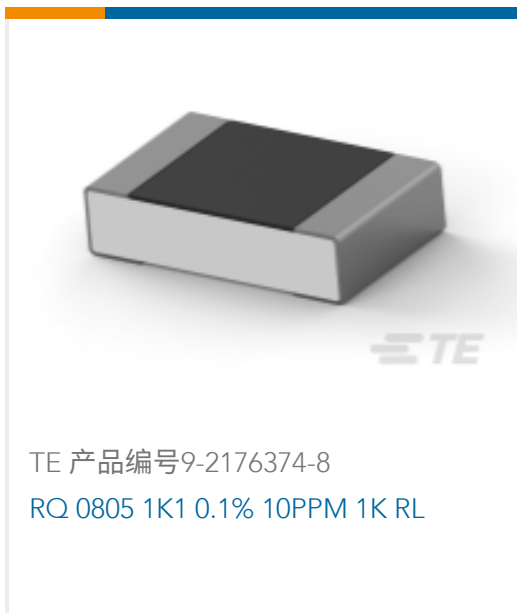
TE 产品编号9-2176374-8 RQ 0805 1K1 0.1% 10PPM 1K RL