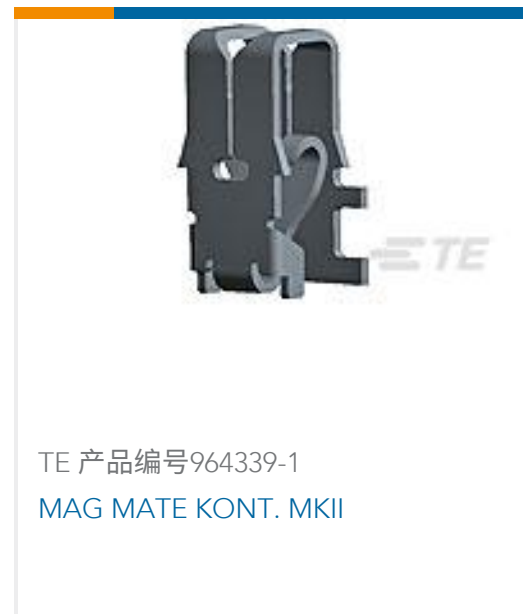
TE 产品编号964339-1 MAG MATE KONT. MKII