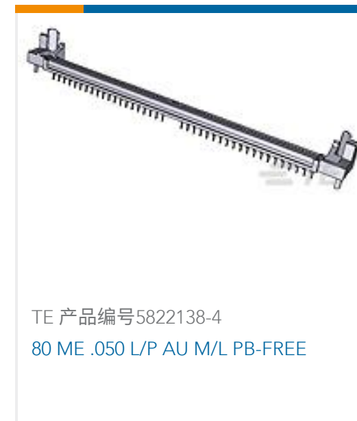
TE 产品编号5822138-4 80 ME .050 L/P AU M/L PB-FREE