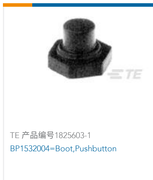
TE 产品编号1825603-1 BP1532004=Boot,Pushbutton