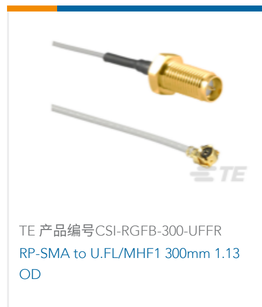
TE 产品编号CSI-RGFB-300-UFFR RP-SMA to U.FL/MHF1 300mm 1.13 OD