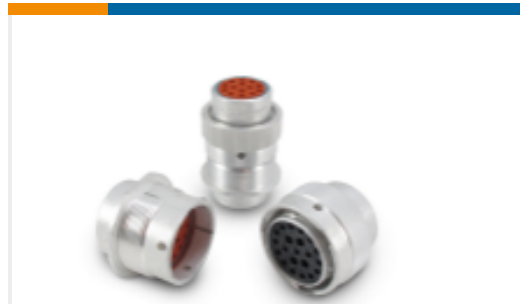
TE 产品编号HD34-24-23PE-072 DEUTSCH HD30 Housings