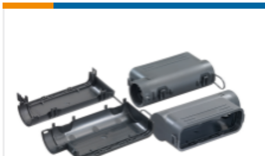
TE 产品编号2500035-3 SRC Male Conduit Cover