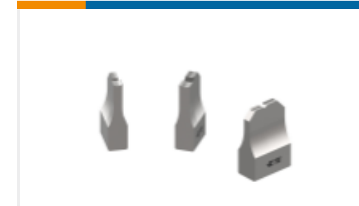
ANVIL REPRESENTATION ONLY TE 产品编号1213862-5 ANVIL, SPLICE TYPE