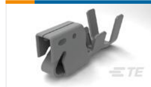
TE 产品编号1744201-1 EP-II CONTACT LANCELESS, 20-16