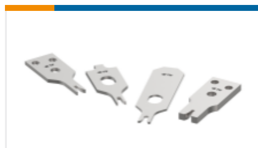
TE 产品编号1803504-1 CRIMPER, WIRE F