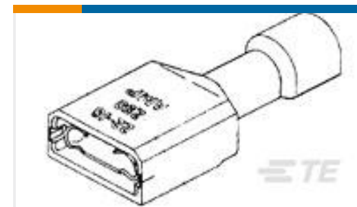
TE 产品编号7-520366-2 ULTRAFAST 110 ASSY REC 26-22 TPBR LP