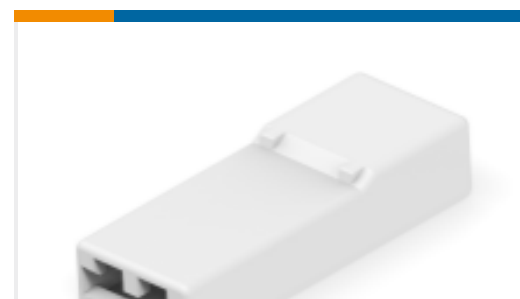
TE 产品编号926539-6 250 FASTON HSG. REC. 1P NATURAL