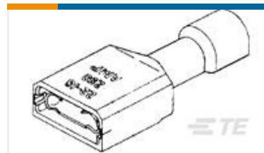
TE 产品编号3-520410-2 ULTRA-FAST 187 ASY REC 16-14 AWG TPBR