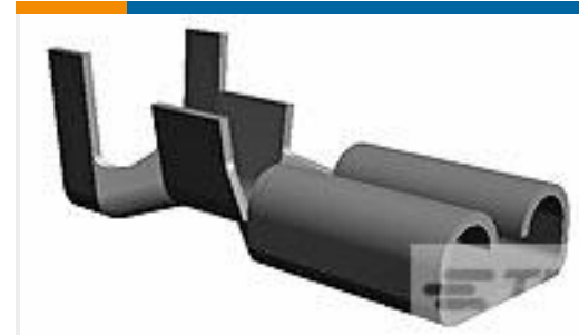
TE 产品编号42452-2 187 FASTON REC 20-16 AWG TPBR