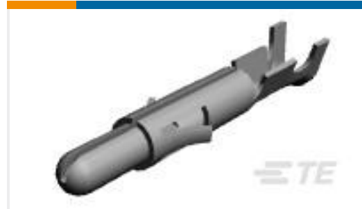
TE 产品编号350561-7 UMNL PIN 24-18 .0126 AU/NI/BR