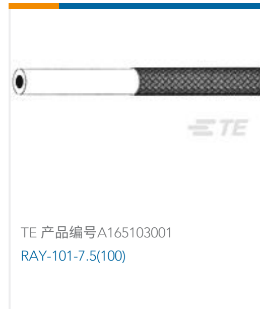
TE 产品编号A165103001 RAY-101-7.5(100)