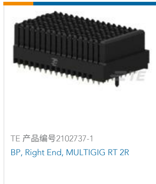
TE 产品编号2102737-1 BP, Right End, MULTIGIG RT 2R