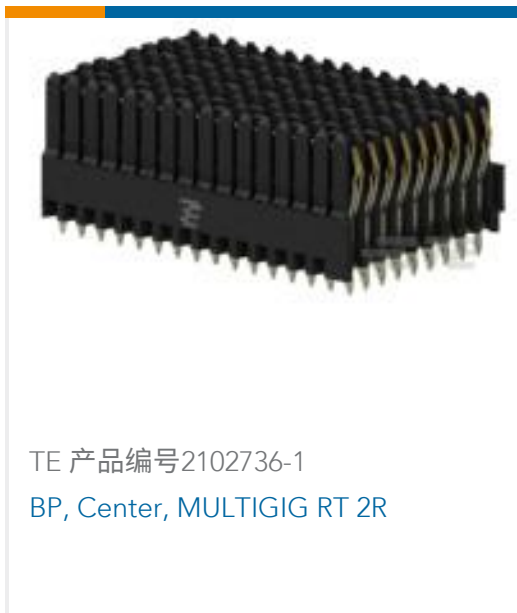
TE 产品编号2102736-1 BP, Center, MULTIGIG RT 2R