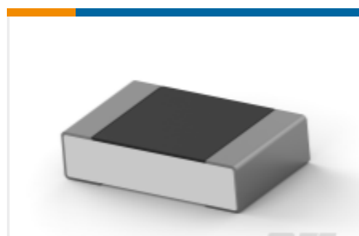
TE 产品编号9-2176374-8 RQ 0805 1K1 0.1% 10PPM 1K RL