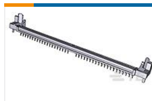
TE 产品编号5822138-4 80 ME .050 L/P AU M/L PB-FREE