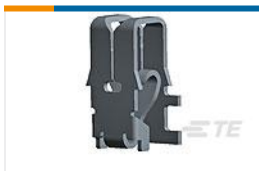
TE 产品编号964339-1 MAG MATE KONT. MKII