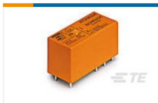
TE 产品编号2-1393243-4 RTE25524