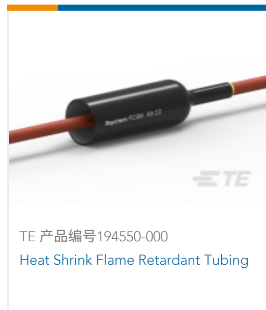
TE 产品编号194550-000 Heat Shrink Flame Retardant Tubing