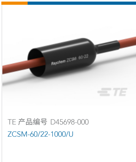
TE 产品编号 D45698-000 ZCSM-60/22-1000/U