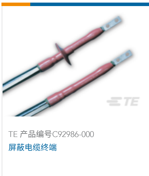
TE 产品编号C92986-000 屏蔽电缆终端