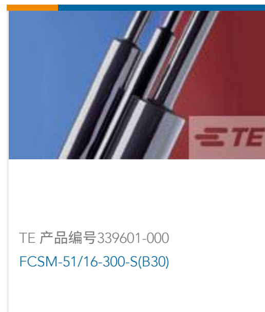
TE 产品编号339601-000 FCSM-51/16-300-S(B30)