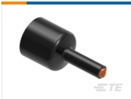
TE 产品编号581913P005 QS1500 热缩管