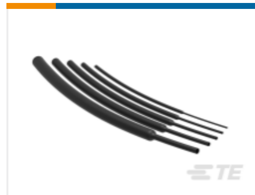
TE 产品编号E05774-000 VERSAFIT-1/4-0-25MM