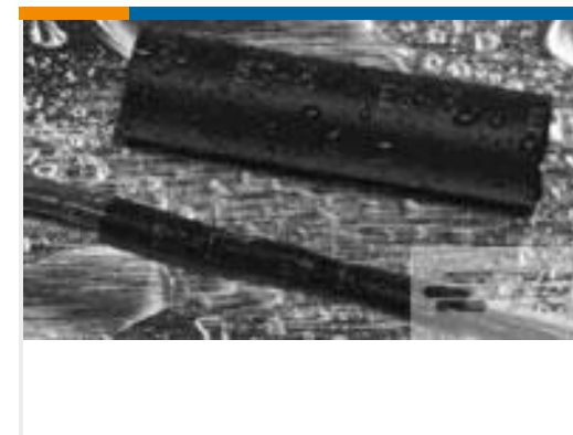
TE 产品编号220781P003 QS1500-NO.5-M1-0-75MM