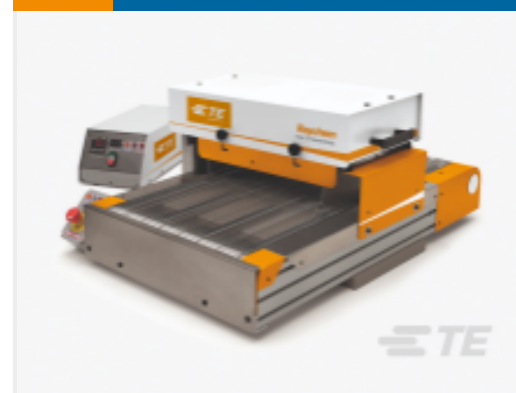
TE 产品编号 955018-000 CLTEQ-M105-TUNNEL-OVEN