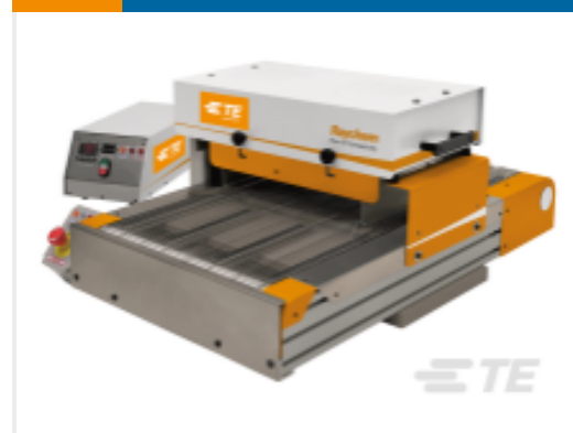
TE 产品编号 2326489-1 MODEL 105 TUNNEL OVEN, 36" ENTRY, STAND A