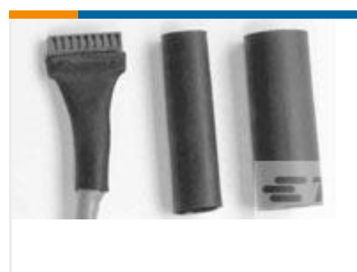
TE 产品编号CA0766-000 DWP-125-1/2-2-1.25IN