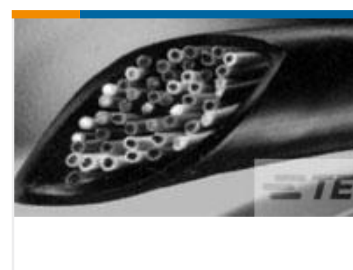
TE 产品编号5550084009 NT-1-1/4-0-SP