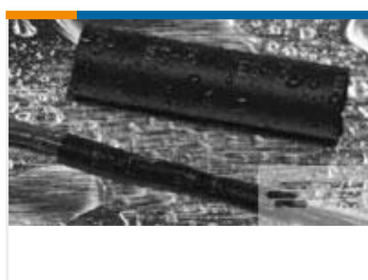
TE 产品编号121397P024 ES2000-NO.3-B8-0-STK