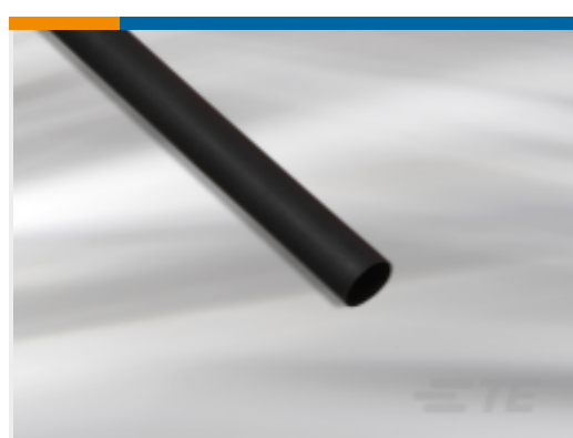
TE 产品编号NB07206001 BATTU 热缩管