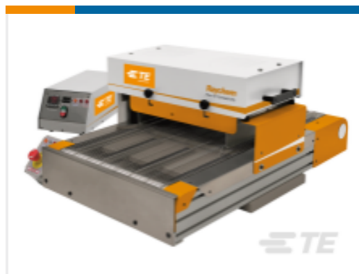
TE 产品编号 2326489-1 MODEL 105 TUNNEL OVEN, 36" ENTRY, STAND A