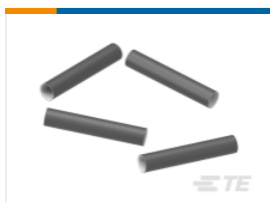
TE 产品编号EP79346001 FL2500-NO.5-P3-0-51MM