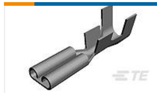
TE 产品编号2232112-1 250 FASTON, REC., 18-14 AWG, TPBR