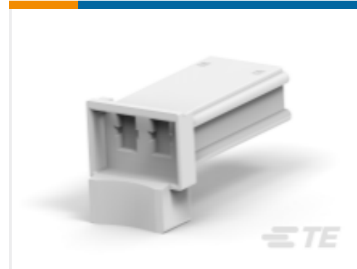
TE 产品编号1-1743216-1 GAS VALVE 2P HSG