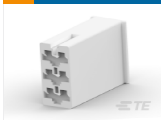
TE 产品编号2-1743068-1 187 HSG. PL MKII REC. 5mm 3P NAT