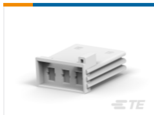
TE 产品编号2-1743217-1 GAS VALVE 3P HSG GWT