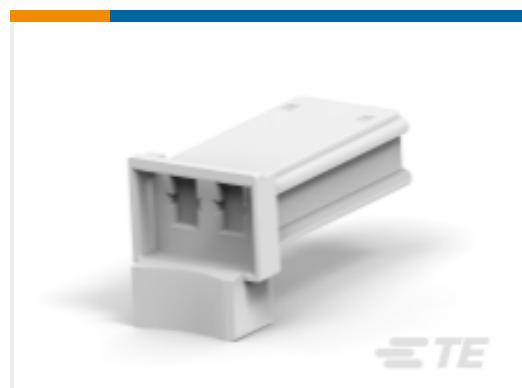
TE 产品编号2-1743216-1 GAS VALVE 2P HSG GWT