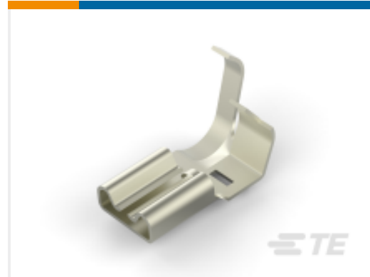
TE 产品编号2238197-3 250 FASTON, FLAG, REC., 18-12 AWG, TPBR