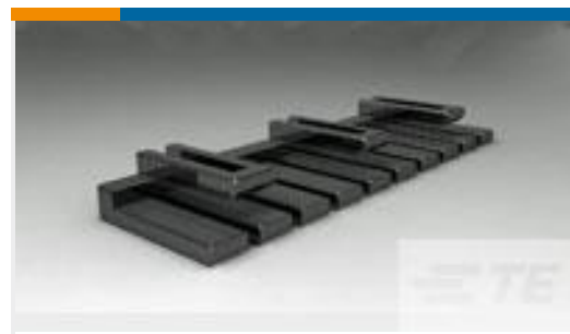
TE 产品编号1969443-9 EP 2.5 TPA Retainer, 9 Pos