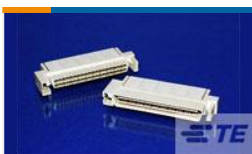
TE 产品编号 6367580-4 ASSY Z-DOK+4 HOST BOARD 32PR