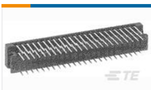
TE 产品编号5-534974-8 150 MODII HORZ 2PC 3R CE 100CL