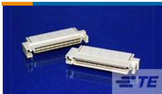
TE 产品编号 6367580-4 ASSY Z-DOK+4 HOST BOARD 32PR