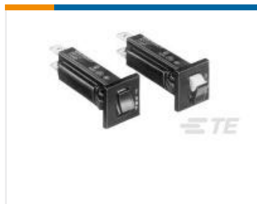
TE 产品编号1-1393250-7 W28-XQAT-15=W28