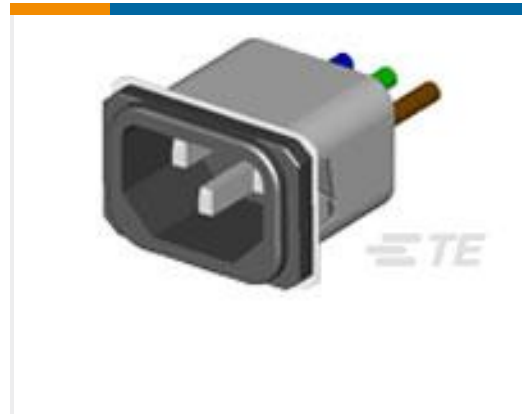
TE 产品编号6-1609987-1 15SRBX8-W=F8287E