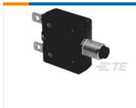
TE 产品编号5-1423674-2 W54-XA1A99C10-15=CKTBKR,THERM,