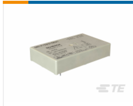
TE 产品编号2045880-4 SRL7-523-D012