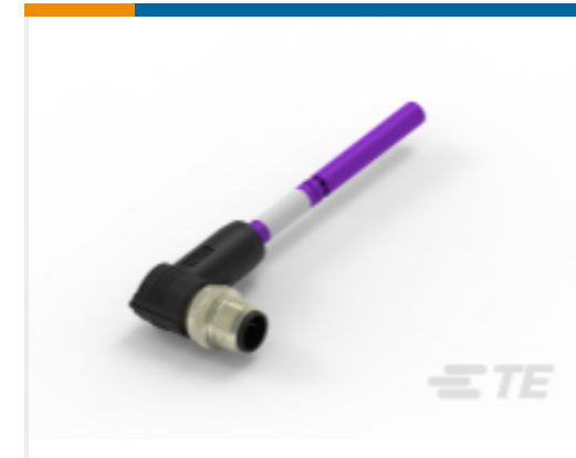
TE 产品编号TAB62235501-001 M12B2-MR-PUR-0.5M