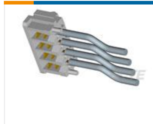
TE 产品编号3-173977-0 CT MT REC ASSY 10P BLUE