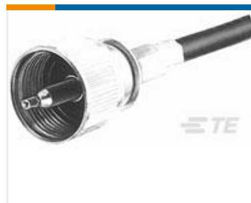
TE 产品编号226279-1 UHF PLUG RG 58 TIN PL