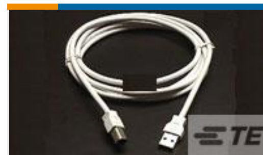
TE 产品编号 1487599-1 USB, A-BLUNT,28/28,BLK,0.83M