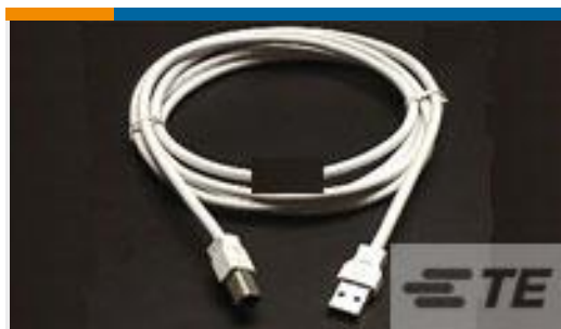
TE 产品编号 1487593-1 USB, A-BLUNT,28/24,WHT,2.0M