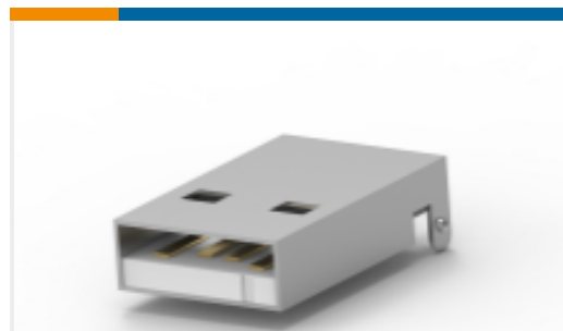
TE 产品编号 1-1734028-1 Std USB, Type A, Plug, Natural