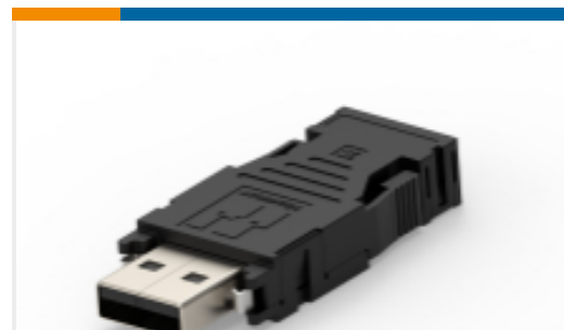
TE 产品编号 1827525-1 MECHATROLINK II CONNECTOR KIT