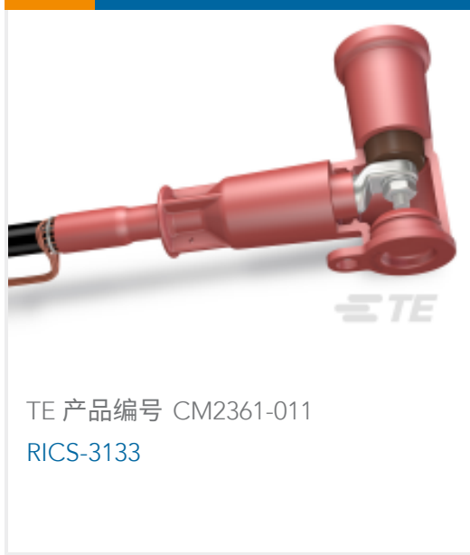
TE 产品编号 CM2361-011 RICS-3133