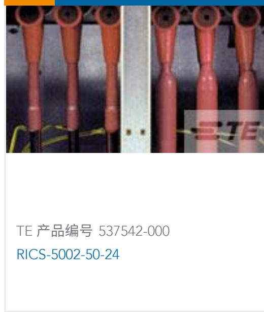
TE 产品编号 537542-000 RICS-5002-50-24