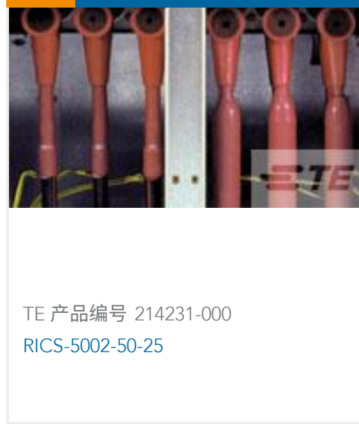
TE 产品编号 214231-000 RICS-5002-50-25