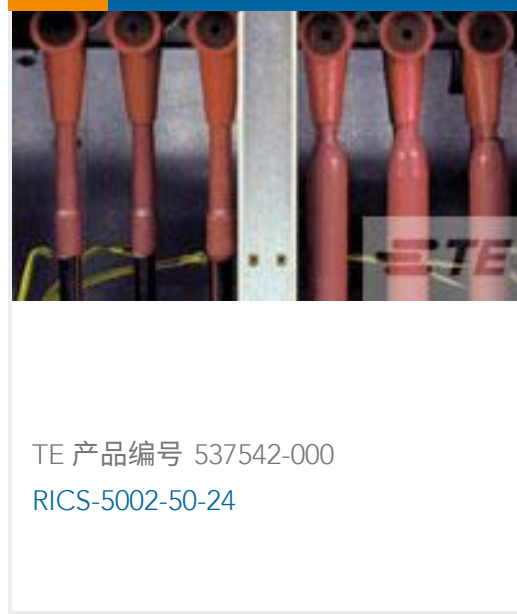
TE 产品编号 537542-000 RICS-5002-50-24