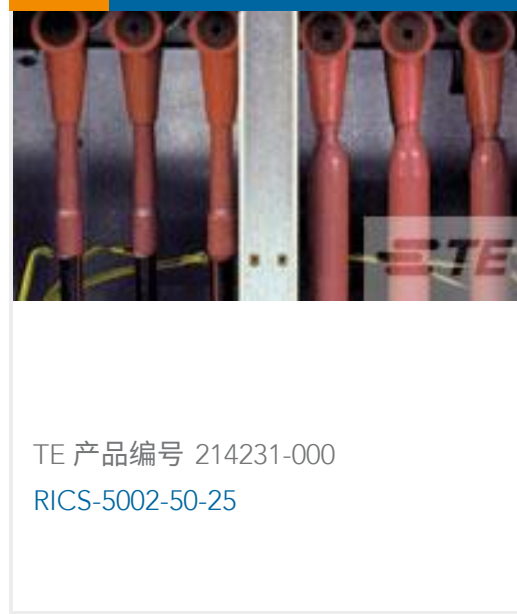
TE 产品编号 214231-000 RICS-5002-50-25