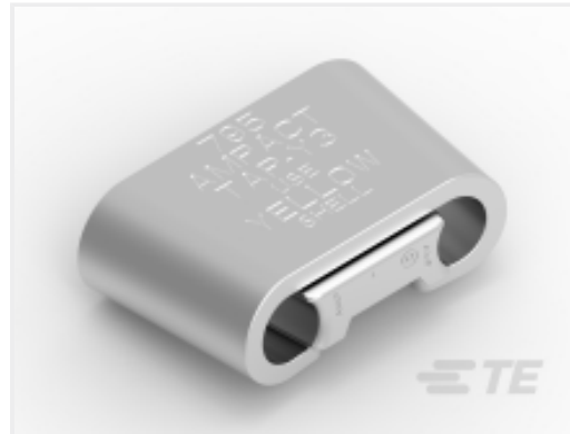
TE 产品编号1443455-1 AMPACT HTT 795.0-795.0