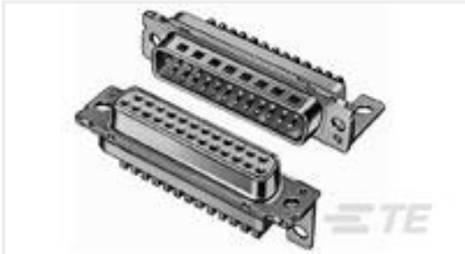
TE 产品编号2-1393480-3 V23529B1121C225-SUB D STIFTLER