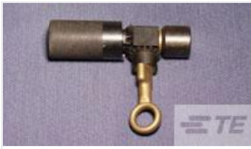
TE 产品编号306347-1 AMPACT GEARED BREECH CAP ASSY