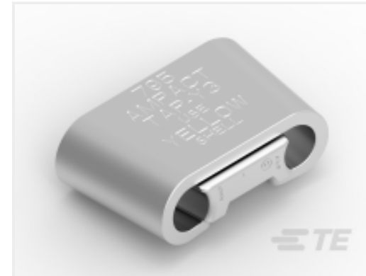
TE 产品编号1443455-3 AMPACT HTT 795.0-636.0