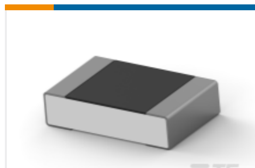
TE 产品编号9-2176374-8 RQ 0805 1K1 0.1% 10PPM 1K RL