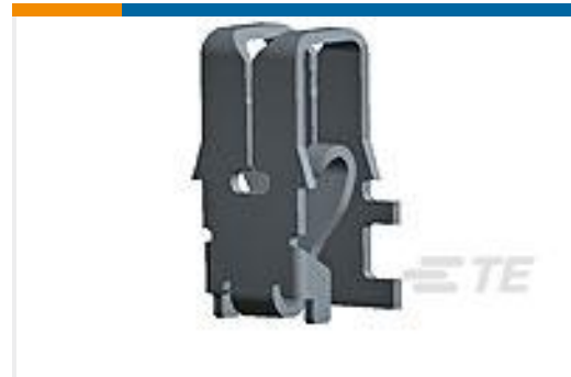
TE 产品编号964339-1 MAG MATE KONT. MKII