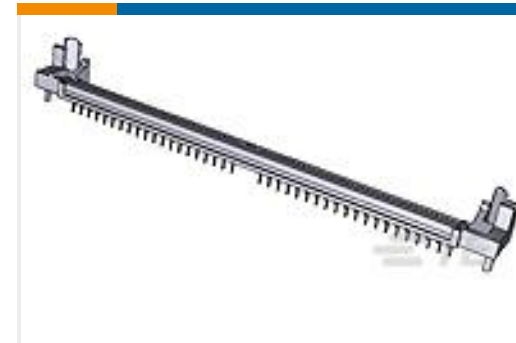
TE 产品编号5822138-4 80 ME .050 L/P AU M/L PB-FREE