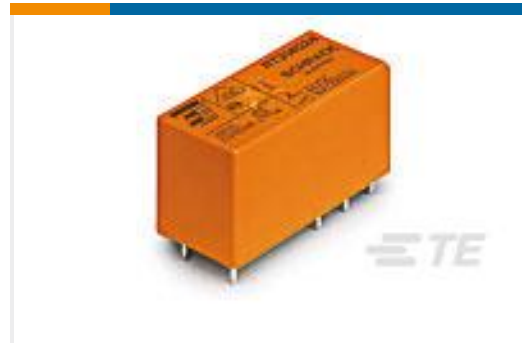
TE 产品编号2-1393243-4 RTE25524