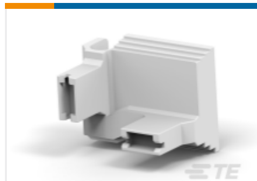
TE 产品编号1969422-2 250 FASTON HSG, FLAG, REC, 2 POS, NATRUAL