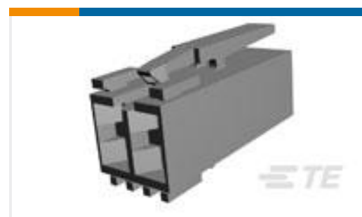
TE 产品编号1241961-1 STD TIM HOUSING MKII 2POS