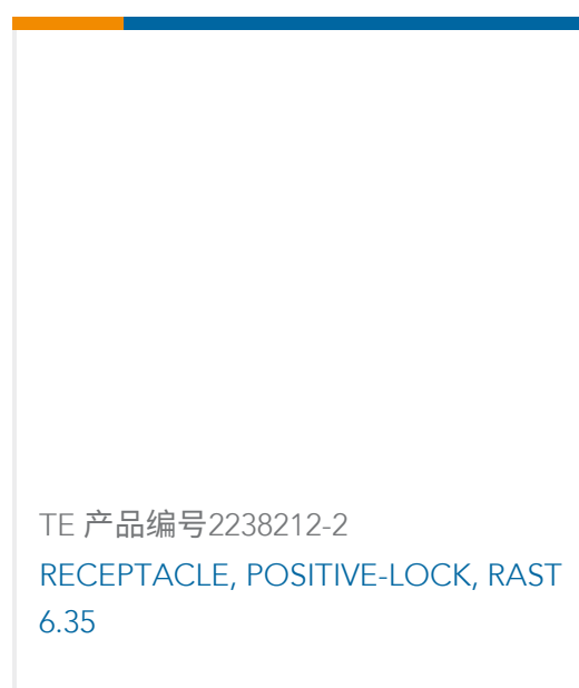
TE 产品编号2238212-2 RECEPTACLE, POSITIVE-LOCK, RAST 6.35