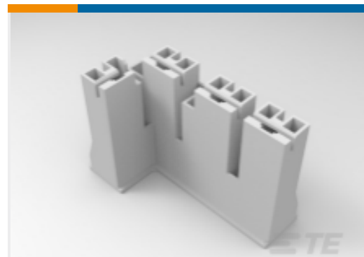
TE 产品编号1969761-1 4P POSITIVE LOCK HSG, MARK II