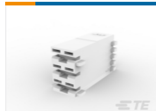
TE 产品编号9-521205-3 POSI-LOK HSG, .250, 3 POS RAST5