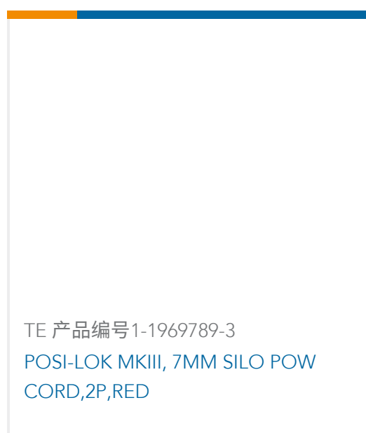
TE 产品编号1-1969789-3 POSI-LOK MKIII, 7MM SILO POW CORD, 2P, RED