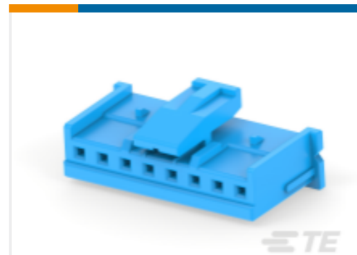
TE 产品编号2-2338183-8 EP 2.5 HOUSING 8P, BLUE, UL version