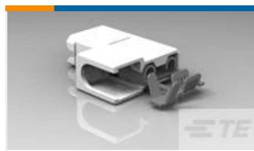
TE 产品编号521411-2 ULTRA-POD 250 ASY REC 22-18 AWG TPBR