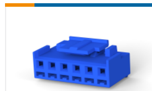
TE 产品编号1744496-6 06P EP-II HOUSING, BLUE