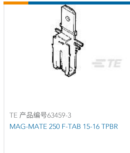
TE 产品编号63459-3 MAG-MATE 250 F-TAB 15-16 TPBR