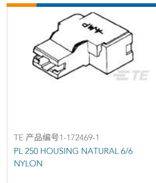
TE 产品编号1-172469-1 PL 250 HOUSING NATURAL 6/6 NYLON