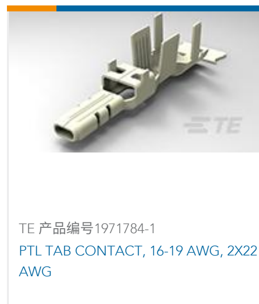
TE 产品编号1971784-1 PTL TAB CONTACT, 16-19 AWG, 2X2 AWG