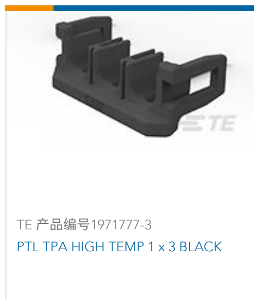
TE 产品编号1971777-3 PTL TPA HIGH TEMP 1 x 3 BLACK