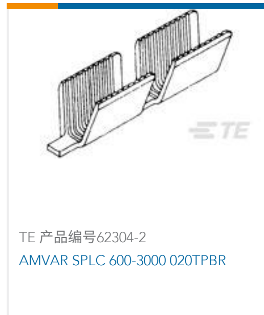
TE 产品编号62304-2 AMVAR SPLC 600-3000 020TPBR