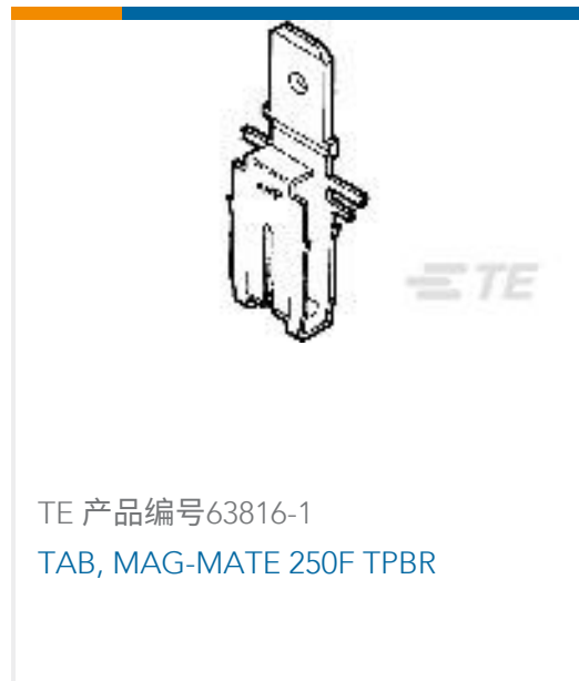
TE 产品编号63816-1 TAB, MAG-MATE 250F TPBR