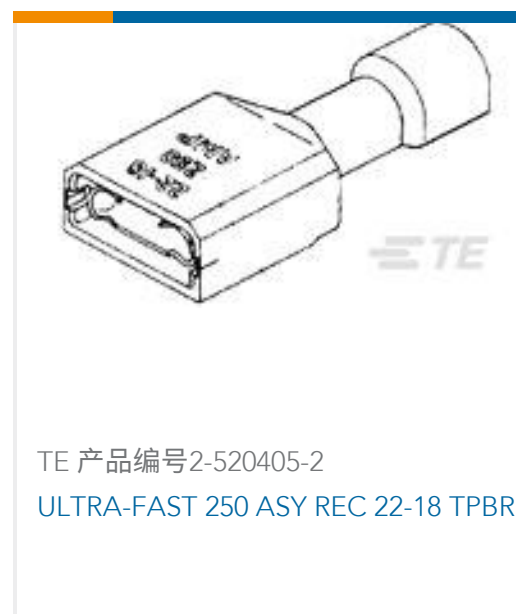
TE 产品编号2-520405-2 ULTRA-FAST 250 ASY REC 22-18 TPBR