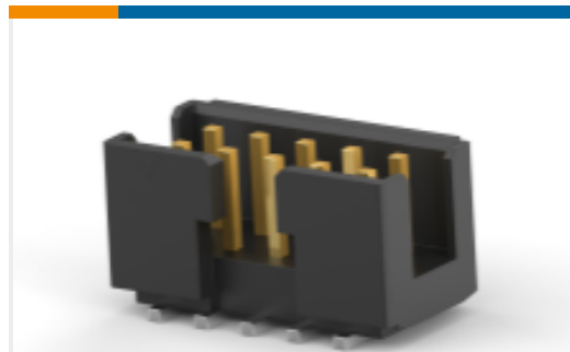
TE 产品编号1-2373376-0 10P,2MM,SHRD HDR,DRVT,SMD,0.1 AU,TB