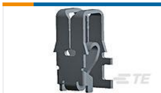
TE 产品编号964339-1 MAG MATE KONT. MKII