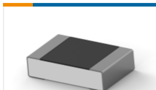
TE 产品编号9-2176374-8 RQ 0805 1K1 0.1% 10PPM 1K RL