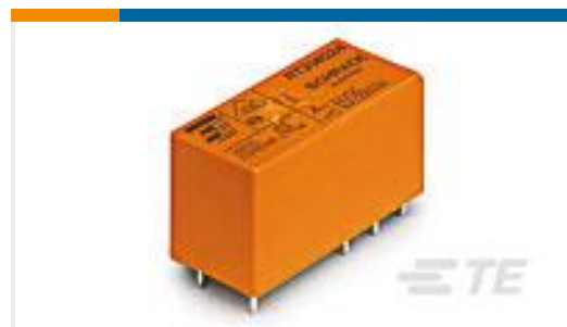
TE 产品编号2-1393243-4 RTE25524