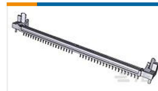
TE 产品编号5822138-4 80 ME .050 L/P AU M/L PB-FREE