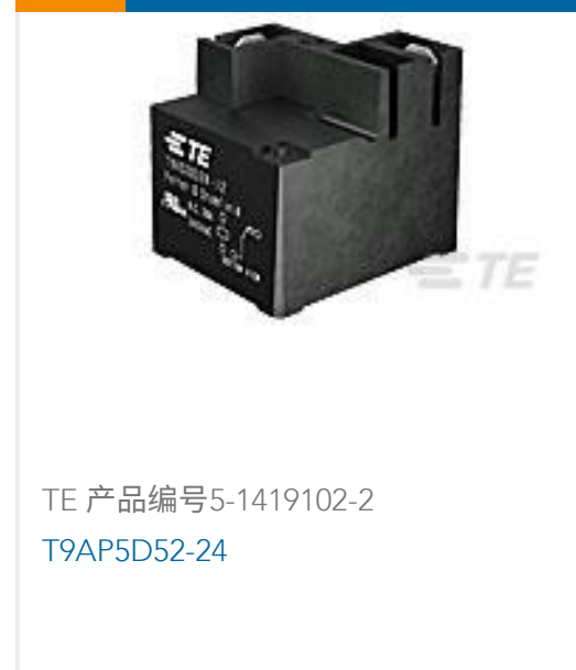
TE 产品编号5-1419102-2 T9AP5D52-24