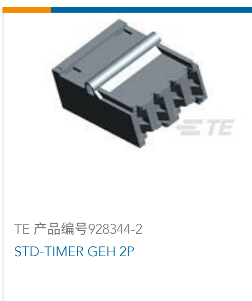
TE 产品编号928344-2 STD-TIMER GEH 2P