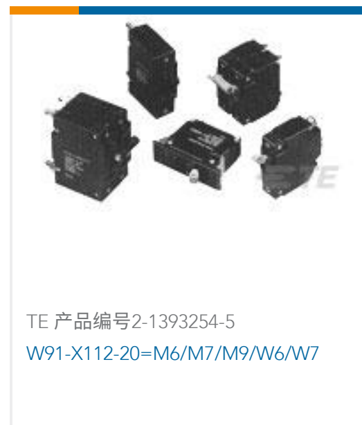
TE 产品编号2-1393254-5 W91-X112-20=M6/M7/M9/W6/W7