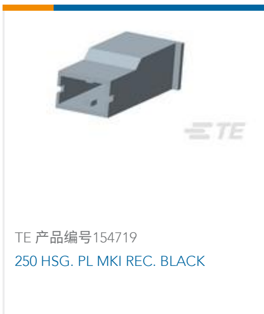
TE 产品编号154719 250 HSG. PL MKI REC. BLACK