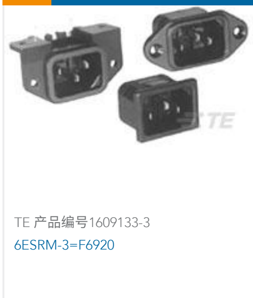
TE 产品编号1609133-3 6ESRM-3=F6920