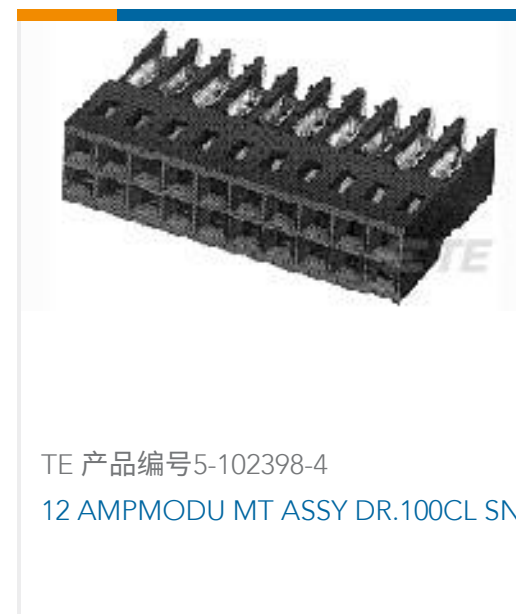
TE 产品编号5-102398-4 12 AMPMODU MT ASSY DR.100CL SN