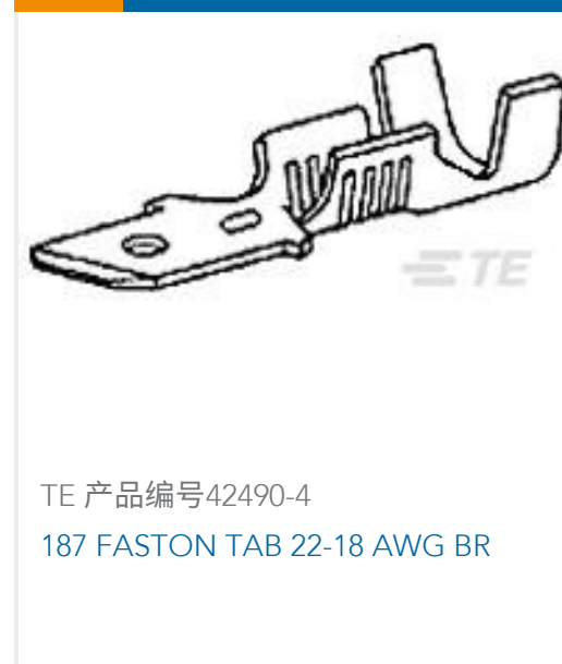
TE 产品编号42490-4 187 FASTON TAB 22-18 AWG BR