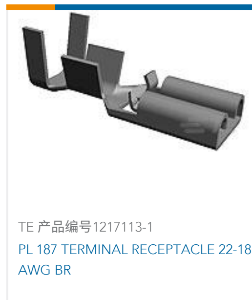
TE 产品编号1217113-1 PL 187 TERMINAL RECEPTACLE 22-18 AWG BR