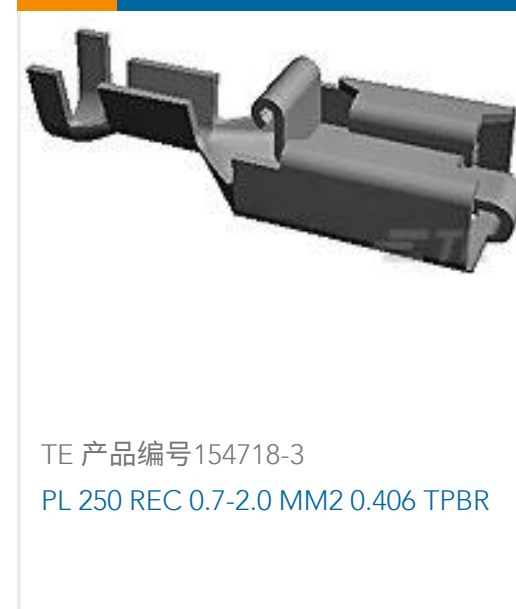
TE 产品编号154718-3 PL 250 REC 0.7-2.0 MM2 0.406 TPBR