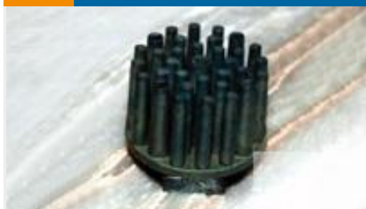
TE 产品编号1-1542001-2 HTS264NF-D=HS ASSY PPA CLIP