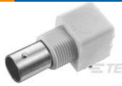
TE 产品编号5415633-1 RTANG BNC PCB JACK - 75 OHM