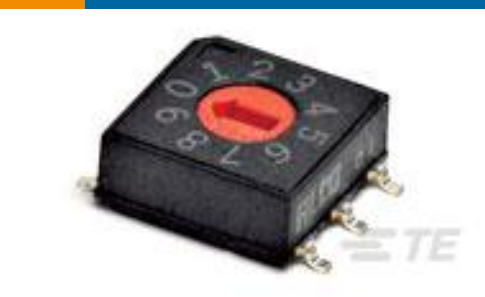
TE 产品编号1825013-6 MRD10CSTR04=7MM ROT DIP, BCD COMP