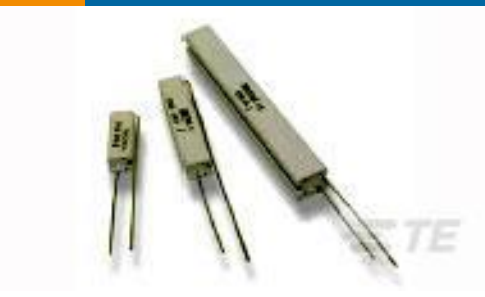
TE 产品编号1623722-4 SBCH 11 33R 5%