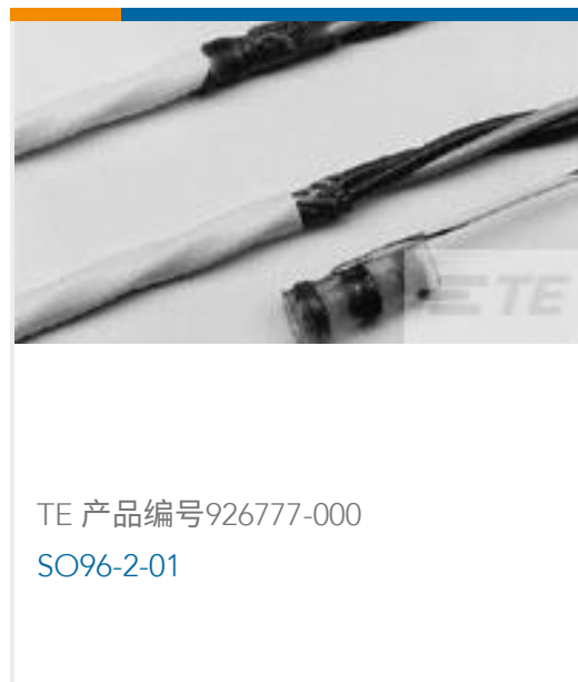
TE 产品编号926777-000 SO96-2-01