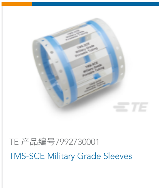
TE 产品编号7992730001 TMS-SCE Military Grade Sleeves