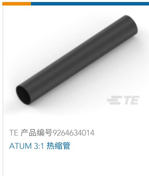
TE 产品编号9264634014 ATUM 3:1 热缩管