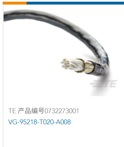
TE 产品编号0732273001 VG-95218-T020-A008